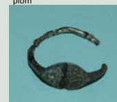
Anell de plata d'Empúries (s. VI aC.), probablement fet amb plata del Priorat