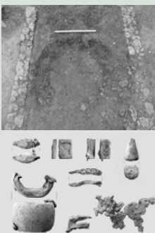
Objectes de plom del Castellat de Banyoles de Tivissa