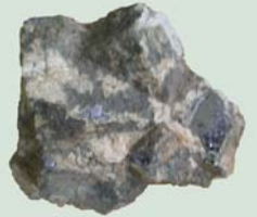
Fragment de galena trobada en un nivell del poblat datat al segle VII-VI aC

Al poblat del Calvari es practicava la metal·lúrgia del bronze i del plom. La presència d'escòries de fosa, de metall en brut, d'un molí que s'utilitzà per a triturar el mineral, i una tovera de forn així ho indiquen. No obstant, el volum de mineral que es processava al poblat era baix. Amb tota probabilitat, la major part del mineral es tractava en instal·lacions situades al peu dels filons; tanmateix, de moment no n'hem trobat indicis. Això és degut a que la morfologia i la vegetació de la comarca en fa molt difícil la prospecció, però, sobre tot, a la gran quantitat de tones de material de rebuig que han anat produint les explotacions mineres fins a del segle XX que han modificat completament el paisatge natural i històric i n'oculten les traces.