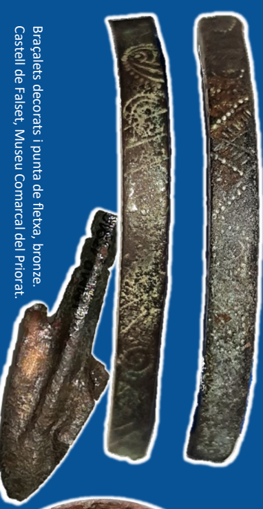
Bragalets decorats i punta de fletxa, bronze. Castell de Falset, Museu Comarcal del Priorat.