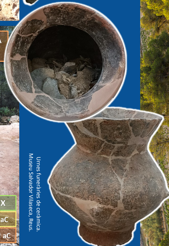
Urnes funeràries de ceràmica. Museu Salvador Vilaseca, Reus.